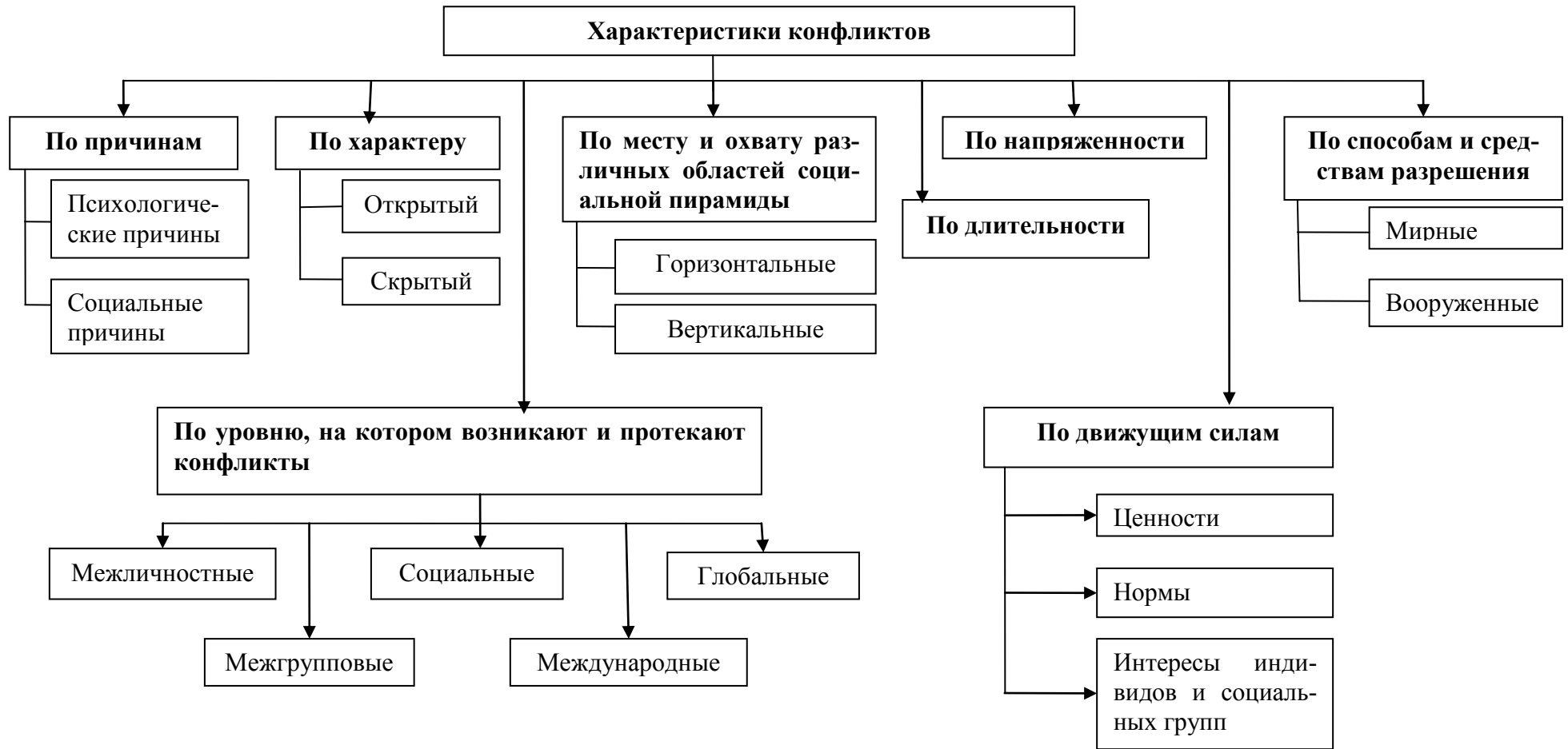
Рисунок 9.1 – Характеристики конфликтов